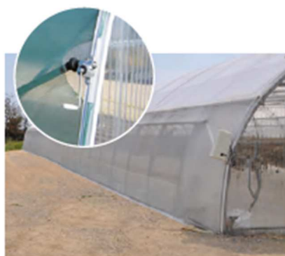
Aération latérale continue par enroulement